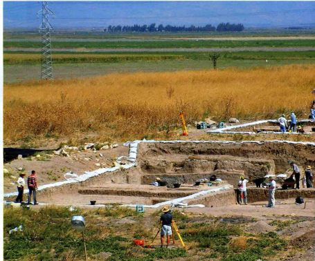
Tayinat Höyüğü 2009 yılı kazı alanı

2008 yılında Toronto Üniversitesi Tayinat Arkeoloji Projesi (TAP) tarafından yürütülen kazıda kısmen açığa çıkarılan Geç Hitit Tapınağının klasik planını veren yapının, anıtsal basamaklı, güneyden girilen sütunların taşıdığı sundurmali ön giriş mekana ait süslü bazalt sütun kaidesi açığa çıkarılmıştır. Kazıda çok küçük kırılmış parçalar halinde ele geçen Luwice (günümüzde konuşulmayan Anadolu yerel dili) taşa oyularak hiyeroglif yazılmış