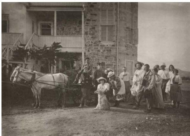
Проводы М. И. Цветаевой и С. Я. Эфрона в Феодосию. Коктебель. Август 1913. Ю. Л. Оболенская — крайняя справа; впереди нее — М. М. Нахман.

Закрывала шляпа пряди Срезанных волос, Было слишком длинно платье В слишком ранний час — Быстрое рукопожатье разделило нас. Слишком юная для дамы, Но большой поэт, Но расстались навсегда мы Иль на много лет. Слишком длинно я отвечу Вам на пару строк. Слишком милой стала встреча В слишком краткий срок.