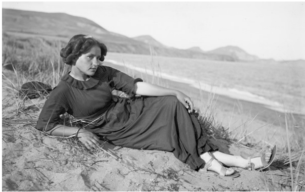
Ю. Л. Оболенская. Коктебель. 1913. Фотография.

О Юлии Оболенской и Константине Кандаурове (продолжение)