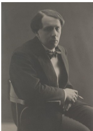
А. Н. Толстой. 1912—1914. Фотография.