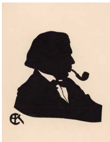
Е. С. Кругликова. Силуэт А. Н. Толстого. 1910-е.