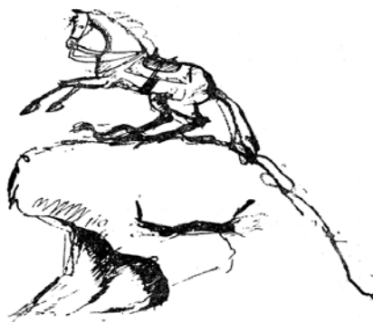
Рис. 4. Медный всадник без Петра (1829). Тазит .