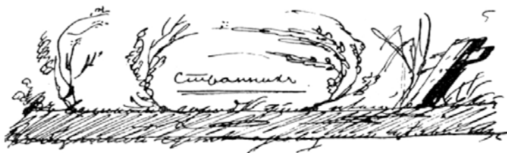
Рис. 1. Заглавие к Страннику (1835)