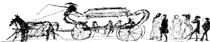
Рис. 2. Похоронная процессия (1830) Грбовицк .